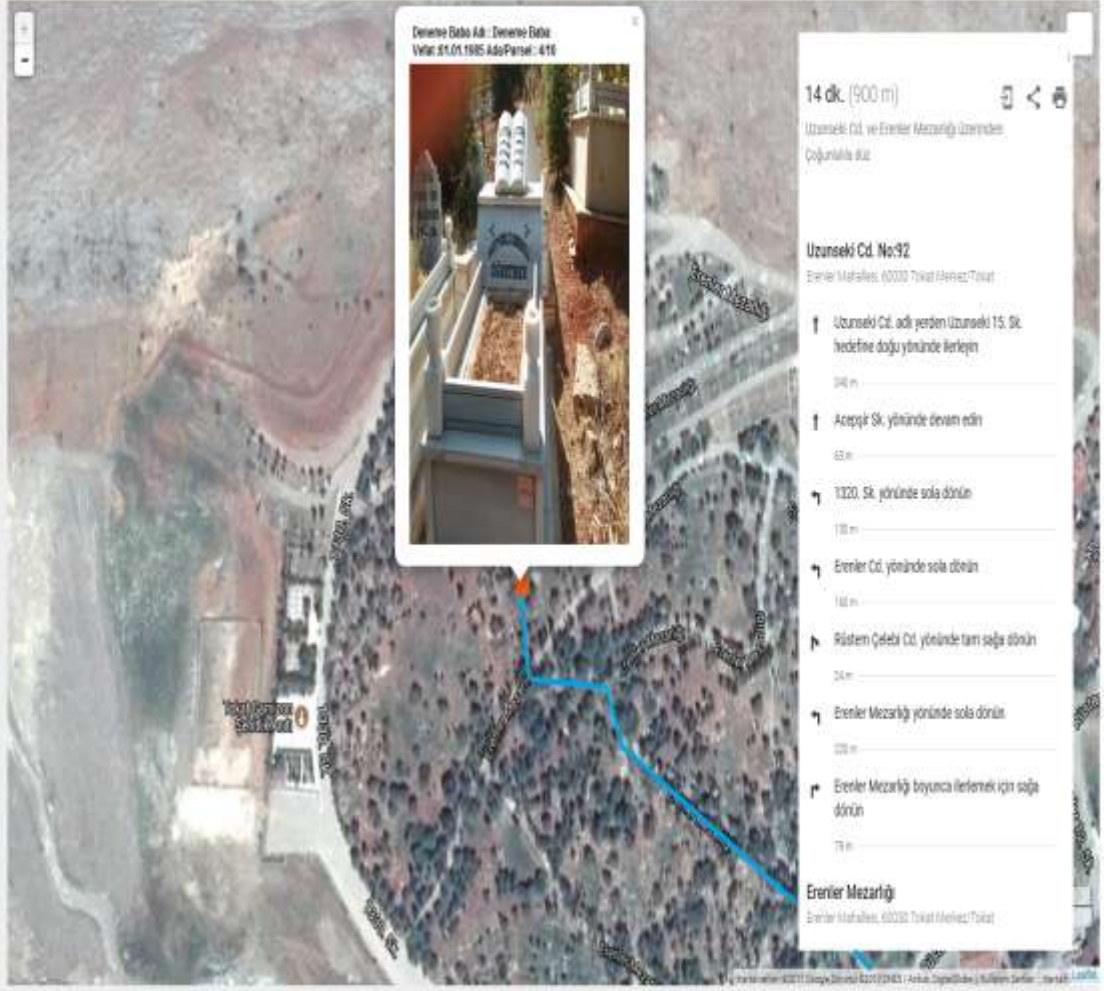
mezarlık genel görünüm oluşturma altlık dahil

'Defin Bilgileri'ni öğrenmek için sorgulama istediğiniz bilgilerin tamamını giriniz. Bilgileri gösterme seçeneği 'SORGULA' butonuna tıklayınız.